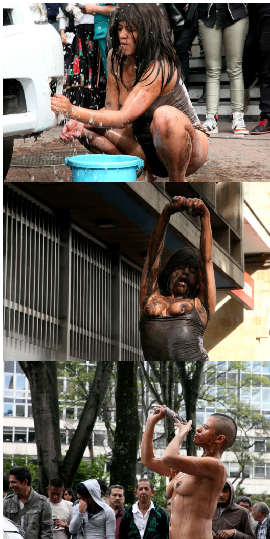
Figura 1, 2 y 3. Registro de performance Carro limpio, conciencia sucia (2013), realizada en Plaza Santander de la ciudad de Bogotá.

movimientos, ritmos y acciones de los cuerpos feminizados. Pero siempre llevando la acción a una imitación hiperbólica de las expresiones genéricas de lo femenino, logrando así un efecto paródico y crítico. De allí que en la propuesta performática de Granados aparezca un cuerpo hipersexualizado a través del personaje de La Fulminante, expuesto no sólo en su desnudez sino en sus movimientos; un cuerpo que hace y -en su hacer específico, concreto, único- genera citaciones desviadas y paródicas que ponen en evidencia la naturalización respecto a lo que pueden hacer nuestros cuerpos.